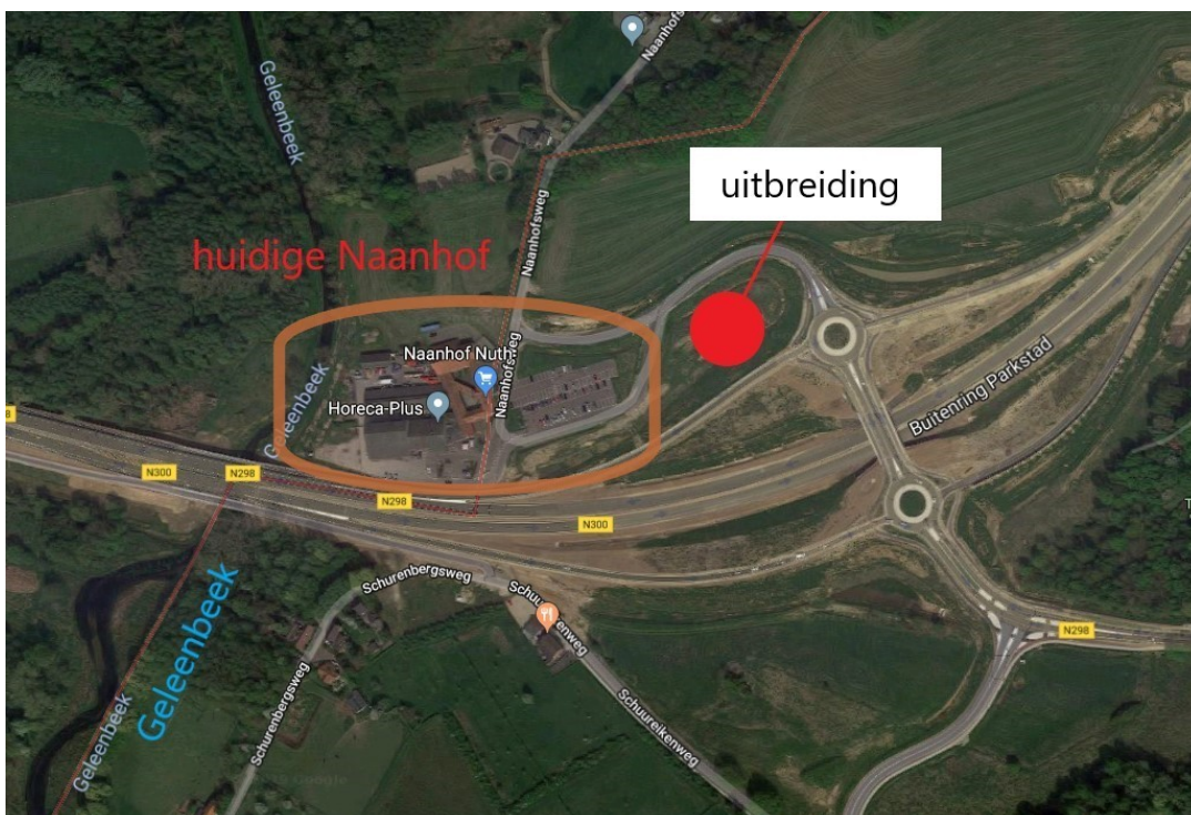
Situatie bij de Naanhof aan de nieuwe Buitenring nabij Nuth.

Wij zijn natuurlijk zeer benieuwd naar het vervolg en wachten op een reactie van de provincie. Ons is in een recent gesprek met alle partijen over deze kwestie toegezegd dat we bij vervolgesprekken betrokken worden.