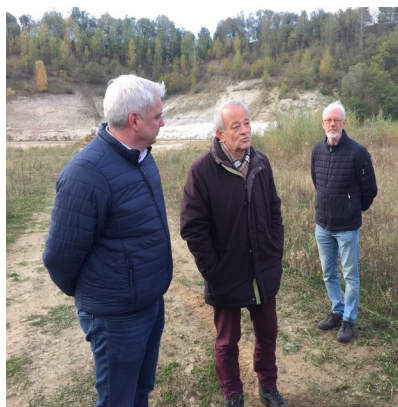
Wandeling met de nieuwe burgemeester