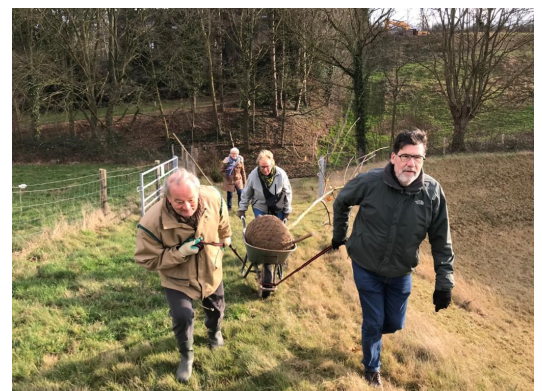
Gedenkboom planten in Nagelbeek