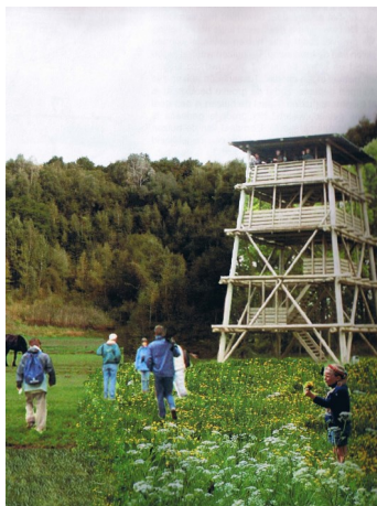
Groeve Schinnen: plannen maken in de voormalige zandgroeve: toekomst-muziek voor extensieve recreatie.

Over compensatie gesproken: de Buitenring is er onder strikte voorwaarden gekomen. Compensatiegebieden werden gecreëerd. Een ligt bij het Natura2000 gebied in de buurt van de Naanhof. Het voornemen om de groothandel van de Naanhof te verplaatsen naar het compensatiegebied was voor ons aanleiding om samen met het IVN Nuth een zienswijze in te dienen. Dat was in 2018. We hebben, waarschijnlijk vanwege de stikstofproblematiek in Nederland, nog geen reactie ontvangen van de provincie.