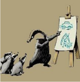
Wij blijven ons inzetten voor de Ecotunnel nabij de A76