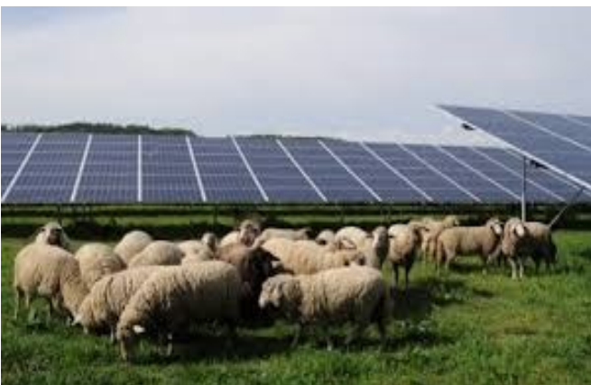
Stortplaats in de toekomst te gebruiken voor de energietransitie. Zonnepanelen op zonneweiden !

Overigens is al ons werk rondom de buitenring niet helemaal zonder resultaat gebleven. Bij de provincie bestond het plan om een deel van de natuurcompensatie bij Reijmersbeek te schrappen. Samen met een aantal partijen in Provinciale Staten hebben wij dit met succes kunnen tegenhouden. De natuurcompensatie bleef behouden!