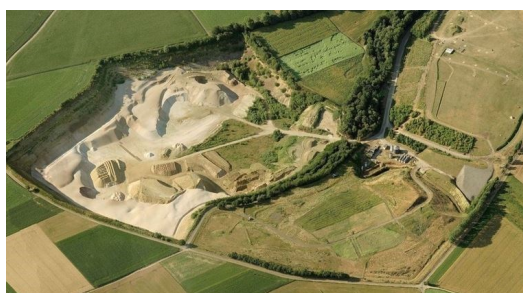
Luchtfoto groeve Schinnen