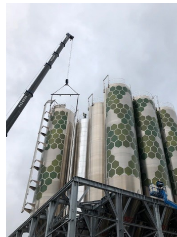
De plaatsing van de silo's van Katoennatie te Nuth: met de groene stippen (bedrijfslogo) vallen ze minder op in het landschap.

Het Geleenbeekdal en hoge silo's vinden wij ook geen geslaagde combinatie. Katoennatie, gevestigd op het bedrijventerrein de Horsel in Nuth, beschikte al over vele silo's. Het voorstellen om 60 silo's van meer dan 30 meter hoog erbij te plaatsen kon ons niet bekoren. Bij de toenmalige gemeente Nuth had men daar geen bezwaar tegen. Wij maakten ons ongehoord kenbaar bij B&W en de gemeenteraad. Er verscheen een artikel in De Limburger. Het bleek dat meer mensen vonden dat deze silo's niet in het landschap van het Geleenbeekdal passen.