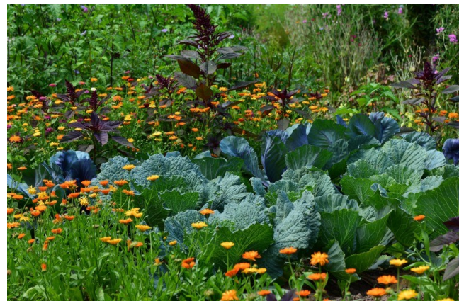
Symposium: voedselbos, kansen in Schinnen-Spaubeek?