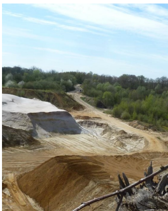
Groeve Spaubeek: ontgravingen.