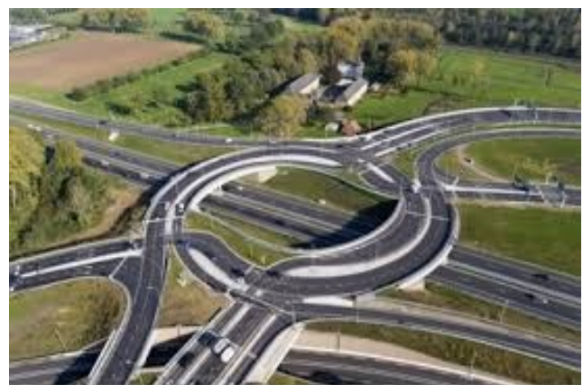
Aanleg Turbo-rotonde Nuth: A76 — Buitenring