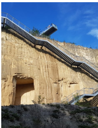
De ENCI groeve, een prachtig voorbeeld voor een herinrichting van een groeve.

Vervolgens werd door Katoennatie met ons contact opgenomen. Men stelde een overleg voor om te kijken of er een mogelijkheid was voor de plaatsing van de silo's die minder storend zou zijn voor het landschap. Hiermee wilde men een eventuele bezwarenprocedure voorkomen.