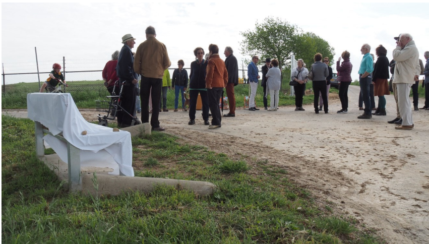
Onthulling van "onze" herdenkingsbank bovenaan in Nagelbeek in het kader van het ontvangen van de "Gonnie Jongmans Award" van de Rotary-club Eisloo-Maaskant, vanwege buitengewone verdiensten op het gebied van o.a. natuur en milieu.

Wij zoeken mensen die tijd willen steken in behoud en verbetering van hun woon- en leefomgeving.