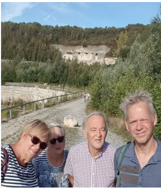
Enkele leden van het bestuur tijdens een inspirerende excursie in de ENCI groeve.