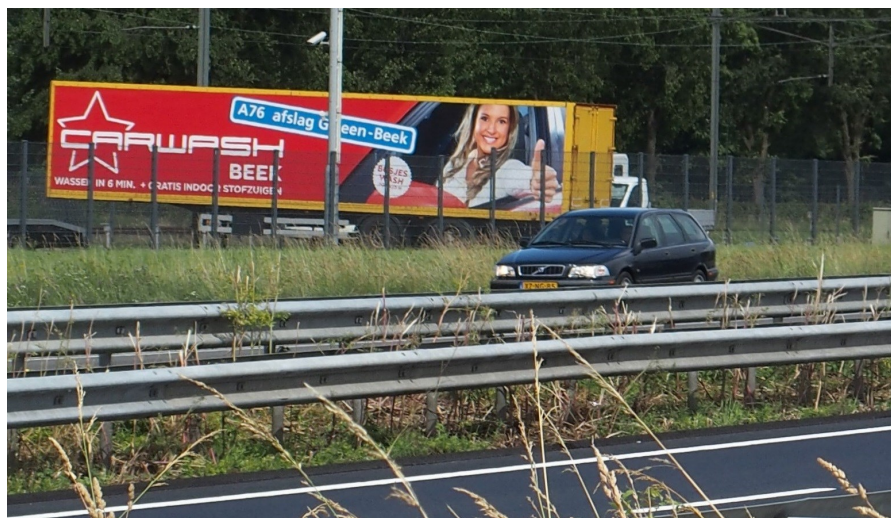
Storende reclame langs de A76 te Spaubeek: landschapsvervuiling.