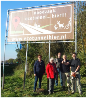
Plaatsen spandoek A76: "Ecotunnel... hier !!!"