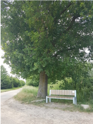
Herdenkingsbank van de milieugroep bovenaan in Nagelbeek.