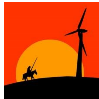
Nog steeds plannen voor plaatsing van windturbines nabij het bedrijventerrein de Horsel in Nuth in het Geleenbeekdal.