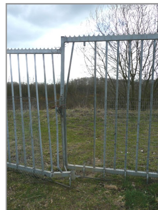
Vernield hek groeve Spaubeek langs Hoorenbergseweg

De afspraak is dat de politie blijft surveilleren en dat wij blijven melden. Als u iets hoort of ziet, vragen wij u om dat ook aan de politie door te geven. Als er mankracht beschikbaar is zal de politie meteen optreden.