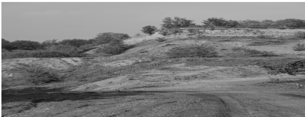
Huidige zandgroeve in Spaubeek

Desondanks werd het gesprek hervat, beseffend dat de gang naar de Raad van State deze ontgronding helaas niet meer zou kunnen voorkomen, gezien het bestemmingsplan en eerdere toezeggingen. Het zou waarschijnlijk slechts uitstel zijn, waardoor we bijvoorbeeld over een jaar misschien opnieuw deze vraag zouden krijgen.