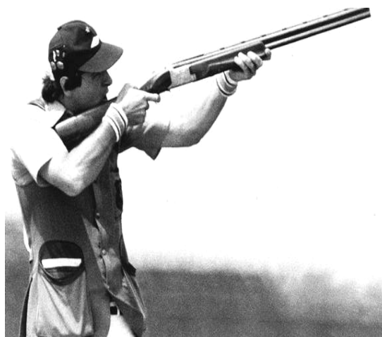
Bij kleiduivenschieten wordt geschoten op aardewerken schotels