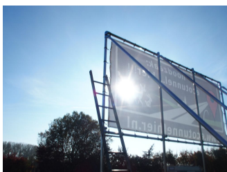
Plaatsen van ons spandoek