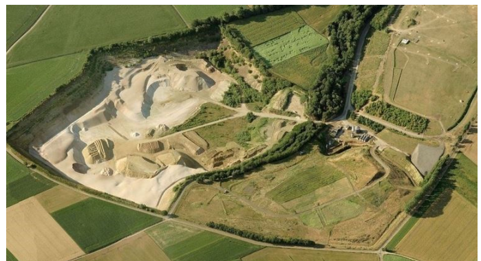
Luchtfoto groeve Schinnen