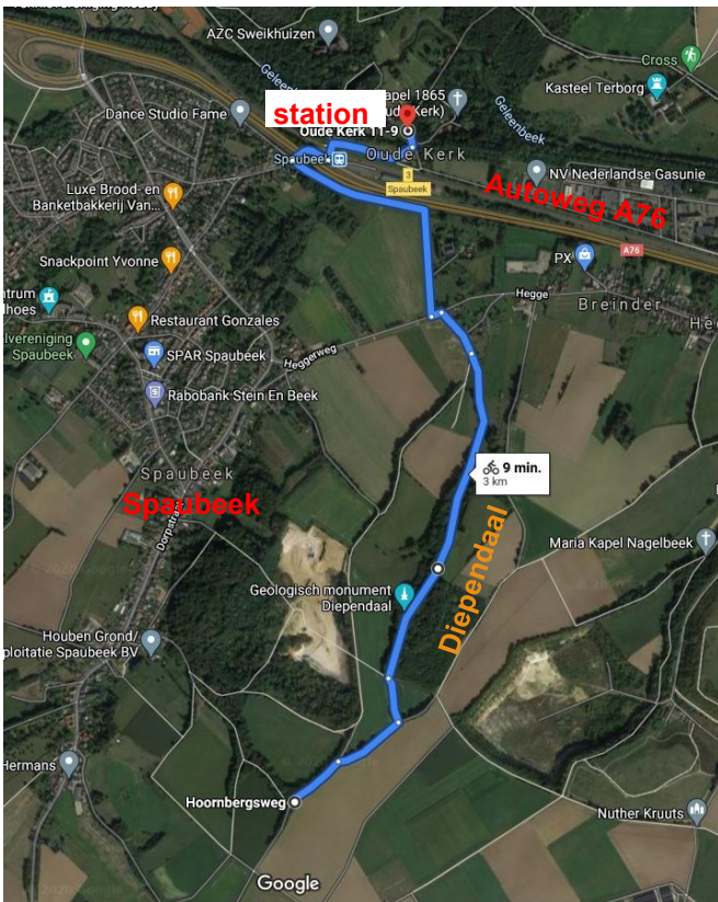
Fragment van de oude Mountainbike-route door De Diependaal

De aanpassing laat echter nog op zich wachten omdat de gemeente Beek hiermee akkoord moet gaan. Wij hopen dat het lukt na jaren overleg!