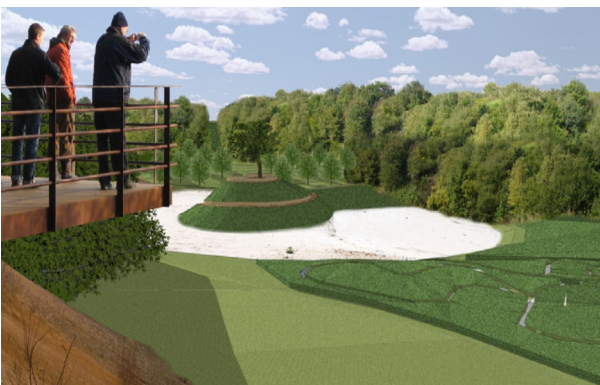
Toekomstige ontwikkelingen in de groeven ?