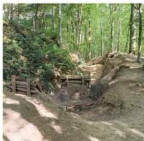
Springschansen in Stammenderbos

Intussen heeft de gemeente besloten niet helemaal akkoord te gaan met ons voorstel. Het fietsen over de Soppestraat vond men te gevaarlijk. De MTB-ers moeten nu beneden aan de Pastorieweg rechtsaf slaan naar de Heggerweg, waarna ze vervolgens via de Dijkerallee richting A76 en het Stammenderbos gaan. Voor ons is deze route acceptabel. De bordjes van de route zijn inmiddels ook aangepast.