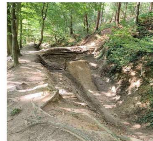
Springschansen in Stammenderbos

Omdat wij sporten in de natuur niet onmogelijk willen maken, maar wel vinden dat kwetsbare gebieden hiervoor niet geschikt zijn, pleiten wij voor een duurzame oplossing. Handhaving is vaak niet effectief. Daarom kan beter in overleg met de gebruikers worden gezocht naar een andere locatie die niet kwetsbaar is. De provincie gaat met de gemeente Beekdaelen in overleg over mogelijke alternatieven. Mocht dit niet tot resultaat leiden, dan zal alsnog handhavend ingegrepen worden. Dit kan door de gemeente in het kader van het bestemmingsplan, door de eigenaar te sommeren de oude situatie te herstellen en/of door handhavend op treden in het kader van de Wet Natuurbescherming. Wij houden jullie op de hoogte van de vervolgstapen en hopen dat de rust in het Stammenderbos spoedig terugkeert.