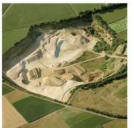
Huidige groeve Schinnen