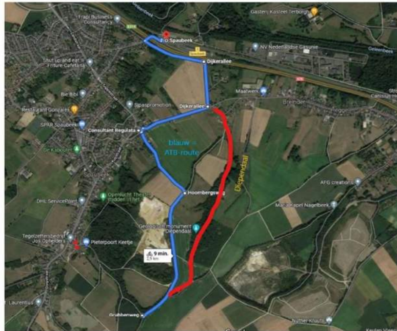
In het blauw: aanpassing MTB-Windraakroute