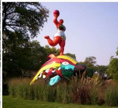
Kunst- en cultuurontwikkeling in natuurgebied Geleenbeekdal