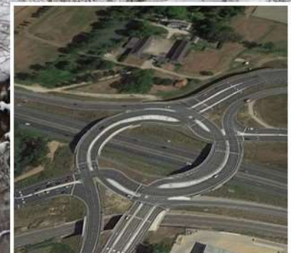
Overkill aan beton en asfalt in schril contrast met natuur en cultuur