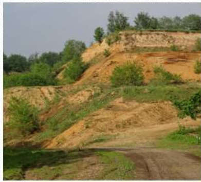
Zandgroeves en verborgen valleien bieden kansen voor het Geleenbeekdal