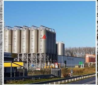
Verrommeling in het Geleenbeekdal door misplanning, industrie en blokkendozen