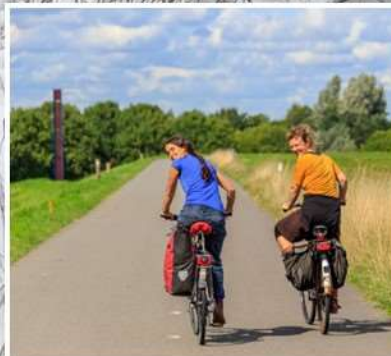
Nieuwe fietspaden en Leisure Lane in het Geleenbeekdal en op de plateau's