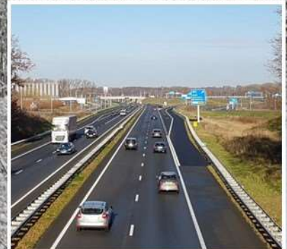
Verkeer perst zich meer en meer door het Geleenbeekdal