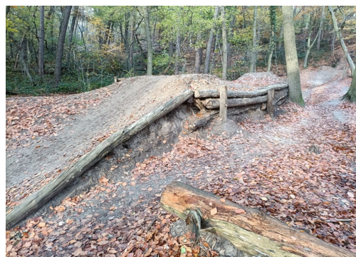
Schans in Stammenderbos