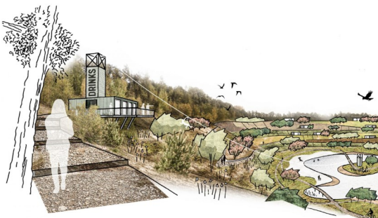
Impressies SILT

Wij zullen de verdere ontwikkelingen rondom Silt met u delen via het stortfront en via onze website www.milieugroepschinnenspaubeek.nl . U kunt natuurlijk ook altijd zelf contact met ons opnemen.